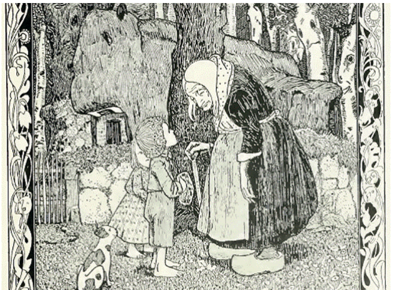
Heinrich Vogeler Hänsel und Gretel , 1902

Les enfants s'avancent dans une forêt de moins en moins hospitalière, jusqu'à ce qu'ils arrivent chez la sorcière... Cette dernière cherche à les attirer à coups de sucreries, mais les enfants ont plus d'un tour dans leur sac.