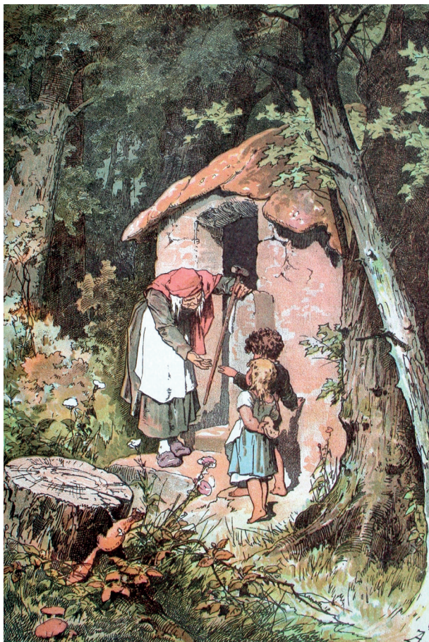
Hänsel und Gretel par Alexander Zick 1845

quelques mélodies qui enchanteront toute la famille et qu'il intitule Une sainte représentation pour les enfants d'Adelheid Wette . Devant le succès de la première représentation familiale, le musicien élargi la composition à seize chansons qu'il fait accompagner d'un piano. Il en termine la partition pour les fêtes de Noël et l'offre en cadeau de fiançailles à Hedwig Taxer, sa future épouse. À peine le nouvel an passé, le frère et la sœur décident de faire de cette composition un Singspiel , une pièce musicale alternant des moments chantés et des dialogues parlés.