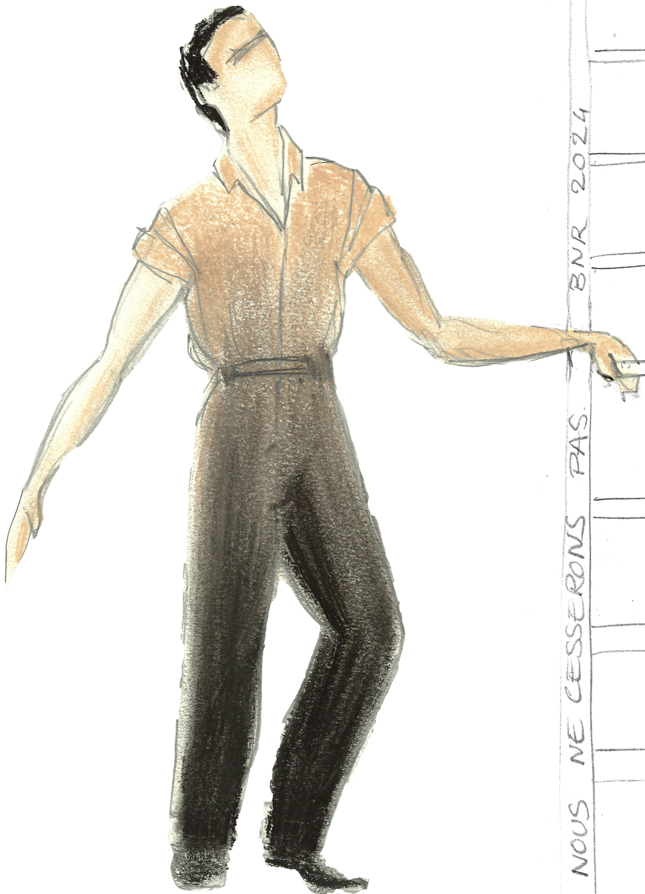
Croquis de Xavier Ronze pour Nous ne cesserons pas de Bruno Bouché